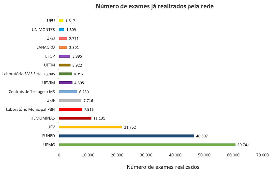
Figura 2. Exames realizados pela rede pública de Minas Gerais

Dados sujeitos a atualização. Atualizado em 09/11/2020. Os quantitativos realizado pelo Instituto René Rachou estão contabilizados como FUNED.