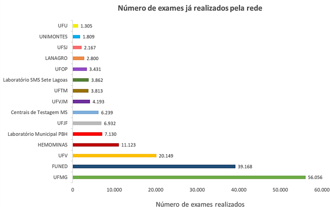
Figura 2. Exames realizados pela rede pública de Minas Gerais

Dados sujeitos a atualização. Atualizado em 26/10/2020. Os quantitativos realizado pelo Instituto René Rachou estão contabilizados como FUNED.